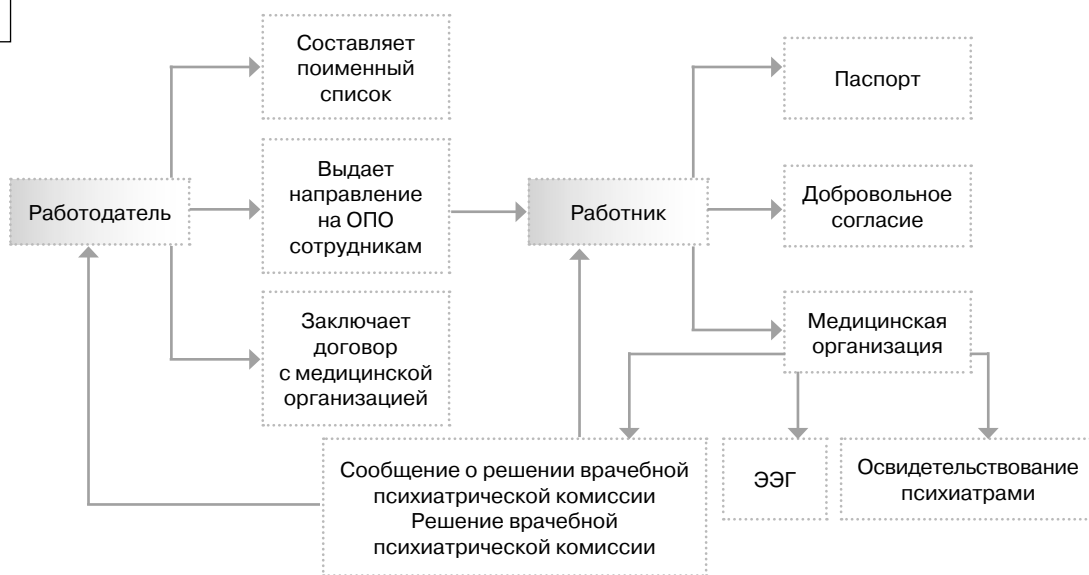
Алгоритм действий работодателя и работника